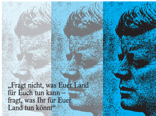
(John F. Kennedy, Amtseinführung 1961)

Wie können die T.I.M.E.S.-Märkte als zentraler Motor der Wirtschaft aus der Stagnation herausgeführt werden? Woher können neue, belebende Impulse kommen? Wie gelingt es, die deutsche Wirtschaft wieder auf Wachstum auszurichten? Wer, wenn nicht die Top Insider, soll das Ganze wieder ins Rollen bringen?